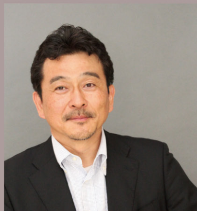
株式会社ラーニング・ラボ 代表取締役

「学校経営「大競争の時代」における 人事戦略再構築の方向性 -教員に緊張と競争原理を(民間企業の取り組みに学ぶ)-」