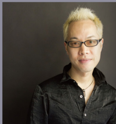
(株)アーチ・コア インコーポレーテッド 代表取締役