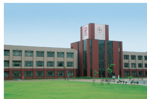
立命館慶祥中学校・高等学校

そのビッグウェーブを乗り切るため、ある学校ではキャリア教育に力を入れたり、有名大学の系列校になったり、男女共学にしたり、ますます大学進学実績の向上に力を入れたり、様々な方向性を模索されていると思います。