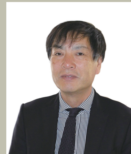
学校法人立命館常務理事（一貫教育担当）

戦後70年が過ぎグローバル化の波は急速に進んでいます。それは政治・経済分野だけでなく、スポーツ・芸術はもちろん教育においてもしかりであります。この間、文科省が唱える大学入試改革も、その上に立ってのものであることは言うまでもありません。立命館の一貫教育（附属校）においては、SGH3校、SSH3校の指定を受けるとともに、イメージ教育やバカロレア教育を展開するなどグローバル化の波にいち早く対応し積極的な学校改革を進めてきました。この各附属校の取り組みの一端を紹介しつつ、「今、教育に求められているのは」何か一緒に考えていきたいと考えております。