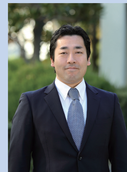
(前)大阪府立箕面高等学校校長